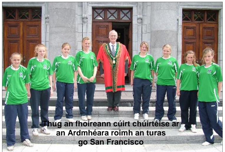
Thug an fhoireann cúirt chúirtéise ar an Ardmhéara roimh an turas go San Francisco

D'eisigh Comhairle Cathrach Chorcaí, trína hOifigeach Forbartha Spóirt, cuiridh chuig eagraíochtaí éagsúla spóirt, agus sa deireadh thiar socraíodh go rachadh foireann cailíní scoile ó Shraith Sacair na mBan agus na gCailíní Scoile Chorcaí go San Francisco le páirt a ghlacadh sna Cluichí, a bhí ann ón 10 go 15 Iúil, 2008.